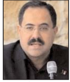
■ بقلم: صبري صيدم

لم يضغط أحد على الرئيس الأمريكي جو بايدن ليقول ما قاله قبيل توليه مقعد الرئاسة في الولايات المتحدة الأمريكية، فالمرشحون جميعاً مطالبون بتحديد مواقفهم من شؤون وقضايا مختلفة، ومنها الصراع العربي الإسرائيلي. وفي ذلك بادر بايدن لإطلاق عودته الستة الشهيرة، التي أكد فيها على ضرورة حل الصراع على أرضية مبدأ الدولتين، ووفق قرارات الشرعية الدولية، والتزامه بوقف الإجراءات التي تؤثر في الحل النهائي لهذا الصراع، وإعادة فتح القضية الأمريكية في شرقي القدس، ورفع الحظر المفروض على مكتب منظمة التحرير الفلسطينية في واشنطن بفتحته، واستئناف المساعدات للسلطة الوطنية الفلسطينية ووكالة غوث وتشغيل اللاجئين الفلسطينيين.