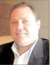
■ بقلم: سري القذوة

لقاء قمة العلمين الثلاثية في القاهرة والتي جمعت الرئيس عبد الفتاح السيسي والملك عبد الله الثاني والرئيس محمود عباس تأتي تصديداً للتعاون والتعاقد الدائم المستمر تجاه القضايا المتعددة على المستويات العربية والإقليمية والدولية من أجل تحقيق التعاون والعمل على إنهاء الاحتلال الإسرائيلي عبر دعم قيام الدولة الفلسطينية والتأكيد على أهمية استمرار العمل من أجل حل الدولتين الذي ينهي الاحتلال الإسرائيلي ويؤدي إلى قيام الدولة الفلسطينية المستقلة مع الرابع من جوان عام 1967. ويأتي انعقاد قمة العلمين الثلاثية مع تزامن العدوان شامل من قبل حكومة التطرف الاسرائيلية وتشكل تلك القمة أهمية خاصة كونها تحمل هموم الشعب الفلسطيني وتعب عن معاناته ولتبحر بالجميع مسؤولياته وتضع القضايا على الحروف وترجم بشكل عملي الموقف العربي الشموخي من عملية السلام مع التأكيد على ضرورة تفعيل الجهود لتحقيق السلام العادل والشامل والذي يلبي جميع الحقوق المشروعة للشعب الفلسطيني وخاصة حقه في الدولة المستقلة ذات السيادة والقابلية للحياة على كامل ترابه الوطني وعاصمتها القدس الشريف وفقاً للقانون الدولي وقرارات الشرعية الدولية.