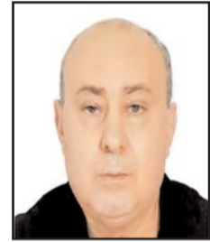
■ بقلم: الهاشمي نورية

ويعيد هذا الجدول إلى الأدهان المحاولات الغربية المتعددة لإفحام السياسة في المحافظ الرياضية وهي محاولات بدأت مع تنظيم الألعاب الأولمبية في ألمانيا في 1936، حينها قال رئيس اللجنة الأولمبية الأمريكية أفري برونديج في معرض رده على المطالبات بمقاطعة الألعاب على خلفية اضطهاد النظام النازي لفئة من الرياضيين لاعتبارات دينية، «إن الركيزة الأساسية للنهضة الأولمبية الحديثة