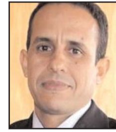
■ بقلم: علي أنوزلا

وكانت نتيجة ذلك حرمان الرياضيين الروس من المشاركة في عدد من المسابقات أو في