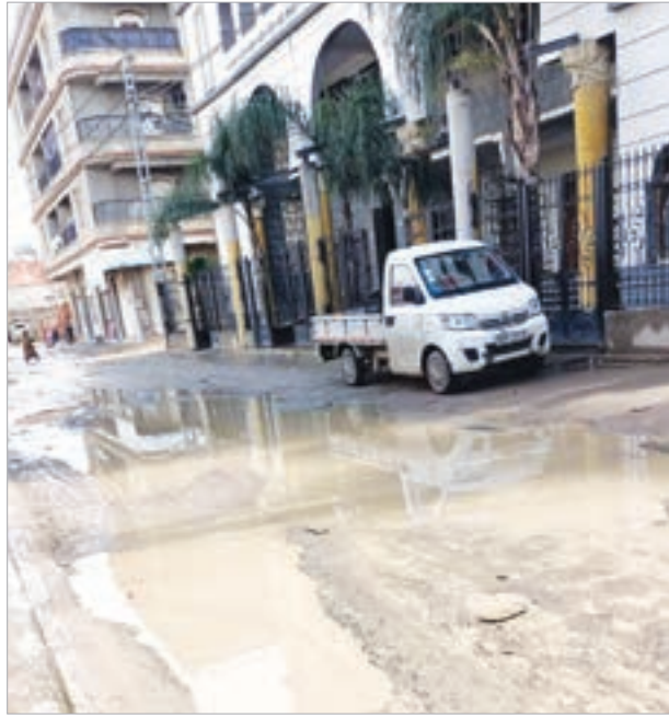
حيث تنتشر هذه الأخيرة بكثرة في مركز غالبية السكان -حسب فصل الصيف نظرا للحاجة الكبيرة لهذه المادة الحيوية. تصريح ممثلهم- على مشكل قاعة العلاج الصغيرة التي تحتاج إلى

كما يفتقر الحي إلى المرافق الرياضية والترفيهية والثقافية، التي جعلت المنطقة تعيش في شبة عزلة بالنظر إلى الأحياء والبلديات المجاورة التي استفادت من بعض المشاريع التنموية والحضارية لصالح مواطنيها معتبرين مطالبهم بسيطة وكفيلة بالعيش الكريم الذي يحلم به قاطنو الحي منذ سنوات، وهذا ما يأمل فيه هؤلاء الذين يناشدون من خلال "الشروق" إلتفاتة السلطات المحلية والولائية لمطالبهم، مع إيجاد حلول مستعجلة للمشاكل التي رافقتهم لسنوات.