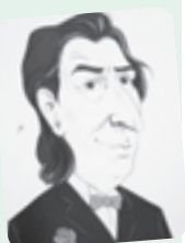
■ بقلم: طاهر حليسي