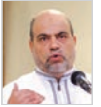
● بقلم: أبو جرة سلطاني

اختفى ذو القرنين فجأة كما ظهر فجأة، ليكشف عن نهاية الأخبار والأشهر ويرشدنا إلى ضوابط المصلحة وسياسة الناس بوساطة مبصرة وخيرية ما مكن الله فيه لكل إنسان من مواهب وقدرات وأسباب وتيسير ..