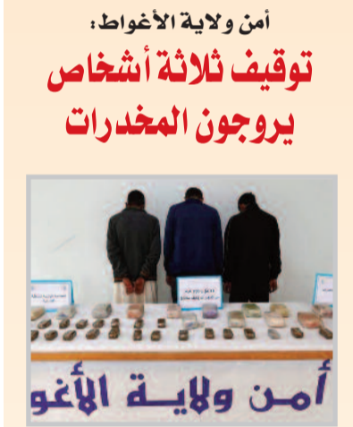
أمن ولاية الأغواط؛ توقيف ثلاثة أشخاص يروجون المخدرات

إن البحث عن طبيعة المصادر المغذية لهذا الاستهلاك النمطي المسيئ للإسلام والمسلمين يستدعي الوقوف على أهم وأبرز العوامل التاريخية التي كان لها دور رئيسي في إنتاج صور محرفة ومسيئة للإسلام، فضلاً عن الوسائل المختلفة الموظفة في تشكيل تلك الصور عبر التاريخ. التحدي الكبير هو تحسين الصورة المشوهة في الإعلام الغربي، وفي ما اعتقده العقل في الضفة الأخرى، وهو هان يقتضي التعجيل في إنشاء إعلام مضاد يسعى إلى تبليغ حقائق صحيحة عن الإسلام وحضارته إلى الإنسان الغربي. مهمة الذود عن الحق وتصحيح الخاطئ من المفاهيم، والوقوف في وجه سعي الترويج مسعى جماعي، ولا ينبغي تحميلها لجنود الحبر وحدهم، فالسهم المنفوث لا يختار ضحاياه، وبشرى الخلاص لا تخرج عن دائرة الضمان الحية، ولنا ضمانة سماوية، أن قافلة الحق ستعبر كافة محطاتها.