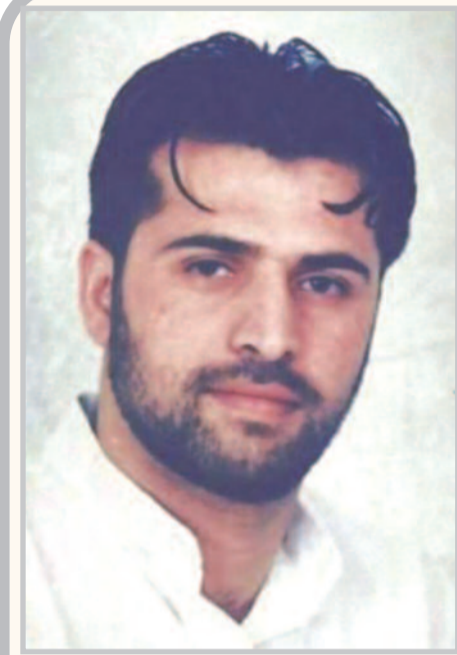
ما هي بسيطة بقدر ما تشكل حلما يصعب تحقيقه للأسير الفلسطيني داخل سجون الاحتلال، هذا فيض من غيظ.