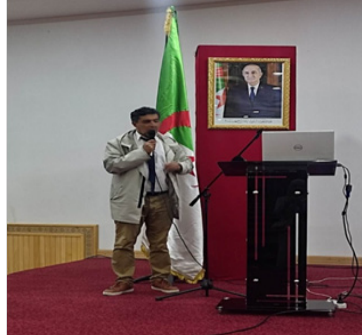
قال احد المتدخلين وجب ان نفرق بين المنظور العمراني والمنظور المعماري.

محورين و على المستويين الداخلي والخارجي (العالمي) مقدما مقترحين، الأول: تشكيل ملفا لتسجيل المدينة القديمة ضمن قائمة التراث العالمي "اليونسكو"، كون الملف معقد للغاية ويحتاج إلى تمويل و خبراء يدرسونه دراسة علمية، المقترح الثاني هو هيكلية العنصر البشري المختص، من خبراء في الأركيولوجية و الفن المعماري في كتابة المشروع للحفاظ على المدينة، مع إشراك المجتمع المدني، يكون ذلك في إطار تشكيل لجان من الجانب الإداري والقضائي تحت إشراف المسؤول الأول على الولاية والسلطات العسكرية. وقال متدخلون من المفروض أن تستقطب المدينة القديمة نشاطات متنوعة و تكون فضاء ثقافيا بامتياز، من خلال تحويل الدور المهملة و استغلالها