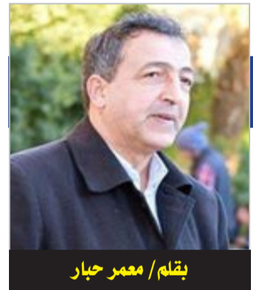
بقلم/ معمر حيار

حيث وعظ النبي صلى الله عليه وسلم النساء يوماً فقال لهن: «إني أريت النار فأطلعتني الله تعالى على النار بقدرته، وكشفت لي عنها، فرأيتها رأي العين، فلما نظرت إليها، وشاهدت من فيها؛ كان أكثر أهلها النساء، فقالت إحداهن: ولم يا رسول الله؟ فأجابها صلى الله عليه وسلم: إنما كن أكثر أهل النار؛ لأنهن يكفرن»، ولم يبين صلى الله عليه وسلم يكفرن بماذا؛ لتتطلع نفوسهن إلى معرفة هذا الكفر الذي وصفهن به النبي صلى الله عليه وسلم،