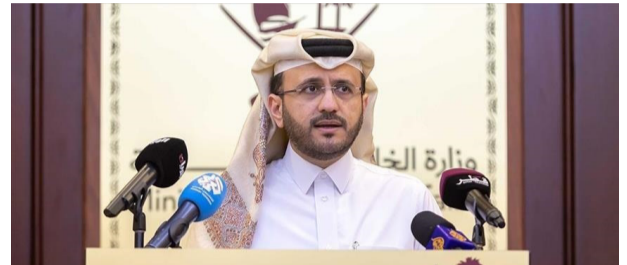
قراءة / محمد علي

كذلك، كشف المتحدث الرسمي لوزارة الخارجية القطرية، أن "الرسائل بين الدوحة والجزائر التي تمت الإشارة إليها، تتعلق بالعلاقات الثنائية بين البلدين"، موضحا أنه "ما لا شك فيه أن رأب الصدع بين الأشقاء يمثل اهتماما رئيسيا لدولة قطر". وأكد محافظ المصرف المركزي الإيراني محمد رضا فرزین، أنه تم الإفراج عن جميع الأرصدة الإيرانية المجمدة في كوريا الجنوبية، موضحا أنها ستودع باليورو "قريبا" في حسابات 6 بنوك إيرانية، على خلفية الاتفاق. وكان نائب وزير الخارجية الإيرانية وكبير المفاوضين الإيرانيين علي بكيري، أعلن الخميس الماضي، بأنه سيتم إطلاق سراح العديد من مواطنيه المحتجزين في الولايات المتحدة، إضافة إلى رفع الحظر عن أموال طهران المجمدة.