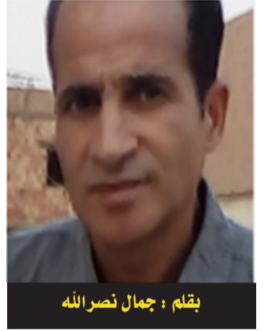
بقلم: جمال نصرالله

يترشح لإحدى المجالس البلدية وعلى رأس القائمة طبعاً. فانخرط على المباشر الأخ الأكبر في صفوف الأخ الأصغر، أي راح يروج ويسوق لحمته الانتخابية على أساس أنه المنقذ الوحيد للبلدية. وعجب العجائب أن الأخ الأصغر والمترشح بالذات لديه خمس سجلات تجارية سبق وأن وظفها في الحصول على مشاريع في التهيئة العمرانية وكذا الإطعام المدرسي والمقولة التي يملك عائداتها يوم كان عضواً بلدياً، واليوم صنع قائمة من أجل الفوز بالرياسة طمعا في الحصول على مشاريع أكبر، والغريب أن كل هذه السجلات التجارية بأسماء لأقارب منه وإليه! أي أن جلها يصب في جيب واحد. والأكد بأننا ليست الحالة الاستثناء في هذا الوطن وإنما مجرد عينة ليس إلا. صاحبنا الذي تحدثنا عنه في البدء هو إسلامي سني محض، وهذا ليس عيباً بل فخراً ومجداً قلما يتحقق في هذا العصر وصعوبات الحياة وتناقضاتها، والثاني المترشح هو ليبرالي أكثر ما عُرف عنه هو انخراطه في الفساد ولا إيمان لديه إلا المال ولغة البنزس. أم المشكلات هنا هي أن الليبرالي كان يغدق على الإسلامي ويده بالمال بما يكفي إلى درجة