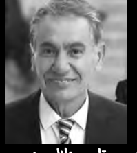
بقلم: خالد نفاوه

ما أعذب قلوبهم، الطاهرة، وما أجمل أنفاسهم العذبة، كانوا يحلمون بلعبة جميلة، تشبع أحاسيسهم المرهفة، لكن حمم الطائرات الأمريكية البشعة الصنع كانت أسرع من أحلامهم، أرواح نقية، صادقة، لا يحملون الكره، لا يعرفون الحقد، والابتسامة لا تفارقهم.