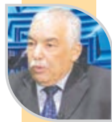
■ لعل بوخالفة

وكما أنه في إطار تنفيذ برنامج رئيس الجمهورية، يمكن فقط تخصيص 1,5 مليون هكتار لزراعة الشوفان من المساحات الشاسعة التي أعلن عليها رئيس الجمهورية،