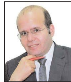
■ بقلم: جمال الكشكي

تغيرت الحسابات الإقليمية والدولية، ثمة مستجدات انحازت لمشروع الدولة الوطنية السورية، الحرب الروسية-