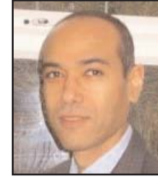
■ بقلم: مالك التركي

وليس من جديد في القول بأن الولايات المتحدة لم تعد تتفرد بالهيمنة على العالم. فقد كان تشارلز كروثامر أحد أكثر الكتاب تبصراً عندما بادر منذ عام