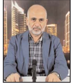
■ بقلم: مصطفى يوسف اللدواوي

عمياء طرشاء قصيرة المدى قليلة الأثر، وما علم أن ترسانتها قد زادت غنى وتنوعاً، وفيها صواريخ ومسيرات، ومضادات وهاونات، وكورنيت مقذوفات كثيرة متنوعة، وما ستشهده المعركة إن طالت أكثر مما يظنه، وأخطر مما يتوقعه.