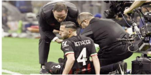
.. هاريس بلقبته

موهبة ميلان منح مؤخرا موافقته على تمثيل منتخب الجزائر بعد أن مثل في السابق منتخبات فرنسا للشنات السنية. وعلى غرار عوار، يملك الأخير القدرة على اللعب في جميع مراكز خط وسط الميدان بما في ذلك مركز صانع الألعاب. وبإمكان ياسين عدلي أن يدخل حسابات جمال بلماضي في صورة لمتعه بوقت لعب كاف مع النادي "اللومباردي" خلال الفترة المتبقية من الموسم الحالي.