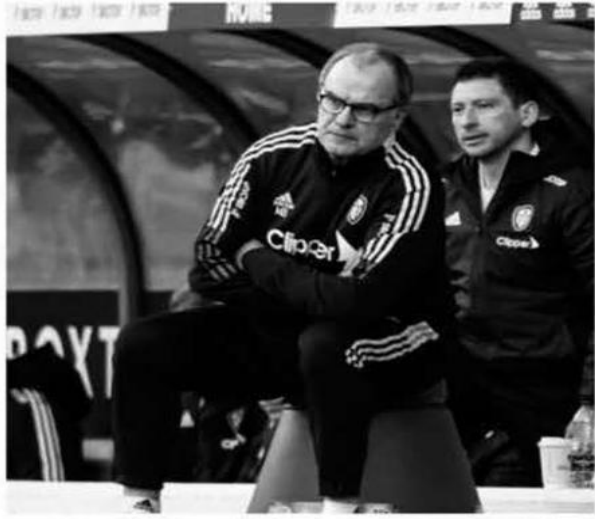
أعلن الاتحاد الأوروغواي لكرة القدم توصله لاتفاق مع المدرب الأرجنتيني مارسيلو بييلسا للإشراف على الفريق الأول حتى نهائيات