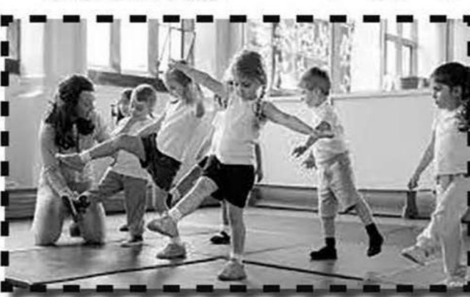
تمارين الصدر برفع الأثقال

الاتجاهات قف وضع تقلّاً في كل يد، واثن كوعك لتجعلهما أعلى كتفك، على أن تكون راحتا يديك متجهة إلى الأمام. تأكد من أن عضلات الوسط تتأثر بالتمرين، وأن العمود الفقري في وضعية مريحة. مدّ ذراعك وافرّع التقلين حتى يتلامسا أعلى رأسك. اثن كوعك مرة أخرى إلى الأسفل، وتوقف عن إنزال الذراعين عندما يكون كوعك أسفل بقليل من الكتفين. كرر التمرين لثلاث مجموعات، وكرّر هذه الحركة 10 مرات في المجموعة الواحدة. من المفيد أداء تمارين الإطالة أو استخدام الأسطوانة الإسفنجية بعد التمارين للمساعدة في تعافي جسّدك بصورة أسرع وتقليل الألم في الوميض التاليين. التزم بأداء التمارين التأسيسية حتى تكون مستعداً نظراً إلى أنك مبتدئ، يمكن أن يكون العمل على تأسيس قوة الجسم محيقاً، وله شعور عامر.