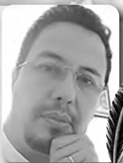
بقلم : حسان زهار