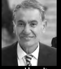
بقلم: خالد نفاوه

ما أعذب قلوبهم، الطاهرة، وما أجمل أنفاسهم العذبة، كانوا يحلمون بلعبة جميلة، تشبع أحاسيسهم المرهفة، لكن حمم الطائرات الأمريكية البشعة الصنع كانت أسرع من أحلامهم، أرواح نقية، صادقة، لا يحملون الكره، لا يعرفون الخد، والابتسامة لا تفارقهم.