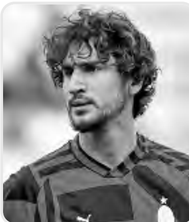
وجهه في وقت سابق رسالة قوية في حسابه الرسمي على "إنستغرام" لبن ناصر.

المشجعين الذين يتألمون كما نتألم نحن أيضا بعد كل مباراة".