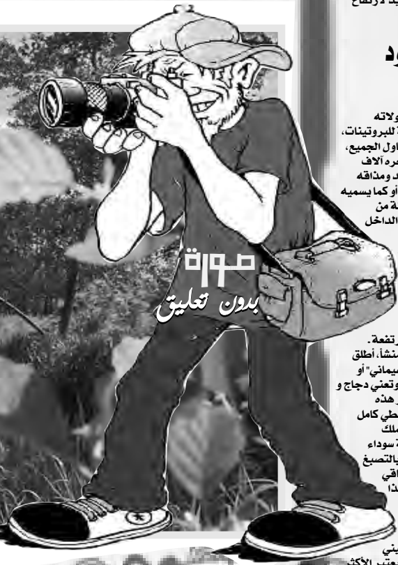
صورة بدون تعليق

لطالما استهلك الإنسان الدجاج في مأكولاته اليومية، إذ يعتبر من المصادر الأساسية للبروتينات، بالإضافة إلى سعره الذي يعتبر في متناول الجميع، إلا أن هناك نوعا من الدجاج يتجاوز سعره آلاف الدولارات، ويرجع ذلك إلى لونه الفريد ومذاقه المختلف. الدجاج الأسود الإندونيسي، أو كما يسمى البعض "دجاج لامبورغيني"، وهي سلالة من الدواجن تتميز بلونها الأسود، سواء من الداخل أو الخارج، ابتداء من ريشه، وصولا إلى عظامه، بينما له دم أحمر مثل لسواد. عكس باقي أنواع الكائنات الحية، ويعتبر دجاج لامبورغيني الأعلى في العالم والأثمن، إذ يبدأ سعر الديك الواحد فقط من 250 دولارا، وهذا السبب الذي استوحى منه اسمه لامبورغيني، نظرا لقيمته المادية المرتفعة. والدجاج الأسود هو دجاج إندونيسي المنشأ، أطلق عليه العديد من المسميات ومنها "أيام سيماني" أو "لامبورغيني"، "أيام" كلمة إندونيسية وتعني دجاج "سيماني" يعني اللون الأسود، كما تشتهر هذه الدجاجة بلونها الأسود الفاحم الذي يغطي كامل جسمها بالإضافة للحمها وعظامها، إذ تملك الدجاجة لحمًا وعظامًا وأعضاء داخلية سوداء بالكامل، الشيء الوحيد الذي لم يصب بالتصنيع وأصبح أسود هو دمه، إلا أنه أغمق من باقي دماء الدواجن العادية. كان ينظر إلى هذا الطائر في إندونيسيا على أنه رمز للمكانة، إذ تحتفظ به العائلات الثرية وتعتني به، وحسب موقع "vice" الأمريكي لدجاج لامبورغيني العديد من أنواع الريش المختلفة، كما يعتبر الأكثر قيمة عالميا.