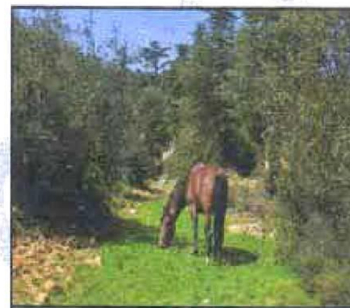
محمية ثنية الحد