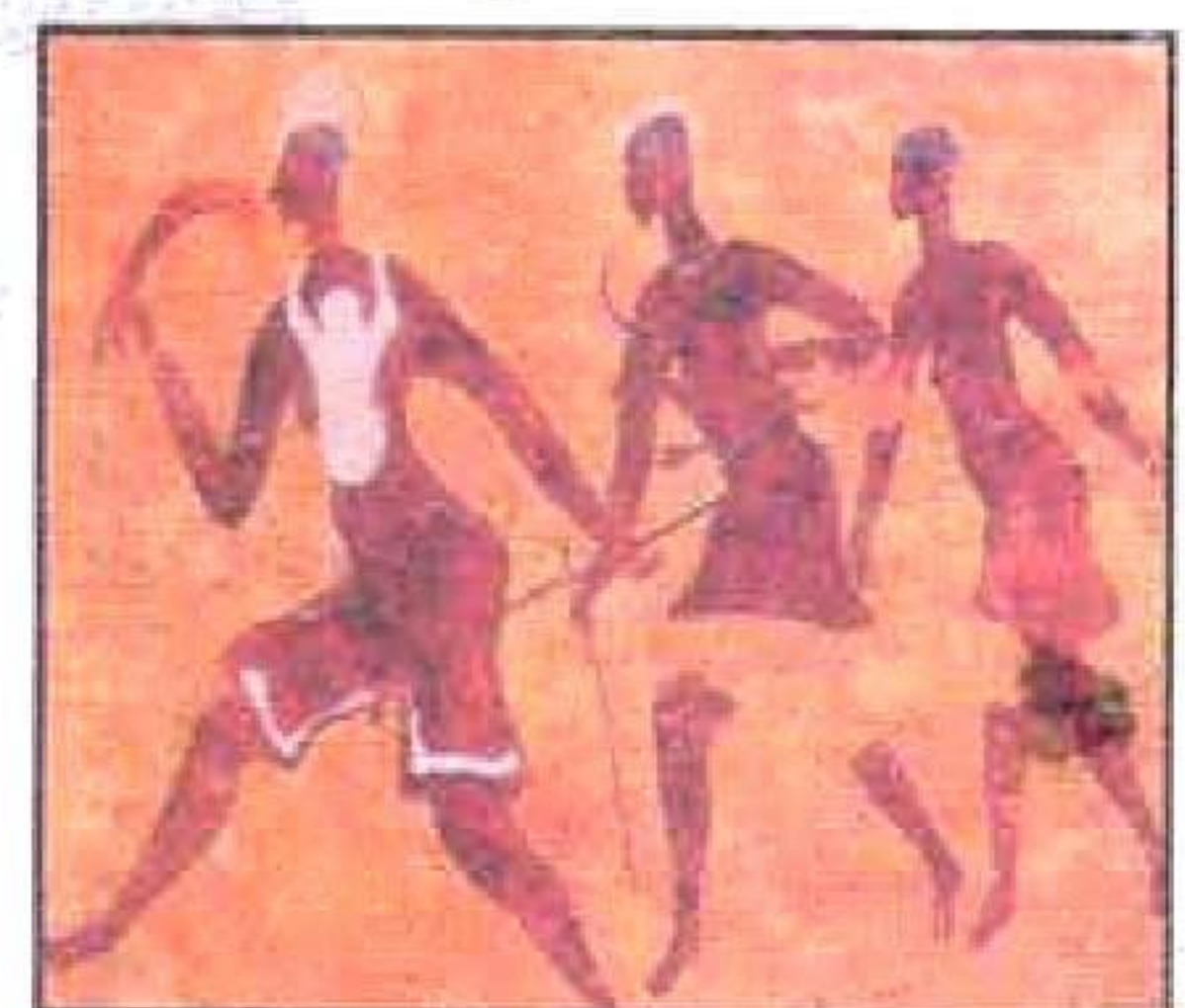
الحظيرة الوطنية التاسيلي