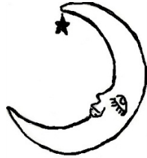
La . . ne