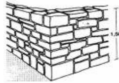
Un . . r