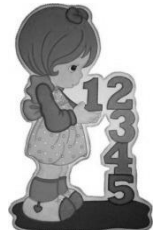
Un . . méro

3- Mets en ordre les syllabes pour écrire un mot : ( 1,5 points )