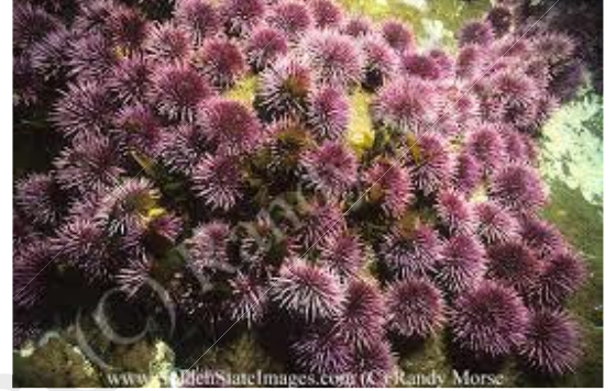
السند 1 : قنفاذ البحر مثبتة على الصخور

السند 2 : يحدث تكاثر قنفاذ البحر في مياه البحر، خارج جسم قنفذ البحر . وتفرز إلى المياه خلايا تكاثرية بكميات هائلة (مليارات الخلايا المنوية وملايين البويضات).