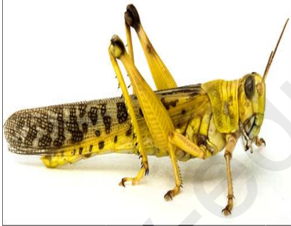
جراد صحراوي بالغ

وأنت تتجول في حديقة جدك في فصل الخريف إذ بسحابة ضخمة تغطي القرية فضننت أن أمطار غزيرة قد تسقط، لكن فوجئت بأن هذه السحابة تكتسح حقول القرية، إنه السرب المثالي، سرب الجراد قد وصل . *- الجراد من الحيوانات اللافقارية :