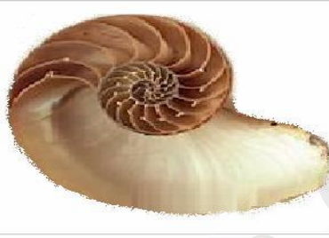
مقطع في قوقعة النوتيل

السند 1: الإستحاثات: هي عملية تحقّر وتحجّر كائنات حية بعد موتها بفعل توضع الترسبات : السند 2: النوتيل حيوان بحري رخو يعيش حاليا في المياه الساخنة للمحيط الهادي