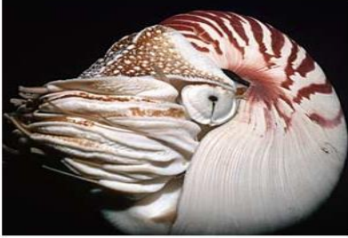
منظر جانبي للنوتيل

النوتيل حيوان رخوي حسسه محاط بقوقعة يعيش حاليا في بعض مناطق المحيط الهندي و الهادي .