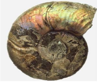
أمونيت العصر الجوراسي AMONNITE DU JURASSIQUE

الأمونيت حيوان رخوي محاط بقوقعة ، يصل قطر بعض أنواعه إلى 3م (m) . عاش هذا الحيوان في الفترة التي كانت تتوحد فيها الديناصورات و انقرض معها . عثر على عتبات لمستحاثات هذه الحيوانات في أنحاء مختلفة من العالم و من بينها منطقة درارية بضواحي العاصمة الجزائرية و مناطق أخرى من البلاد .