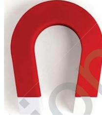
مغناطيس على شكل حرف U