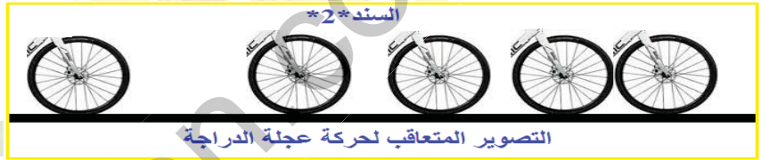
التصوير المتعاقب لحركة عجلة الدراجة