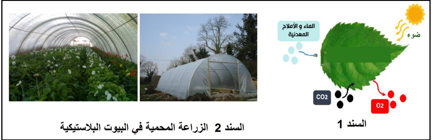
السند 2 الزراعة المحمية في البيوت البلاستيكية