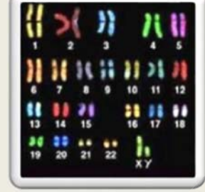
النمط النووي لمحمد