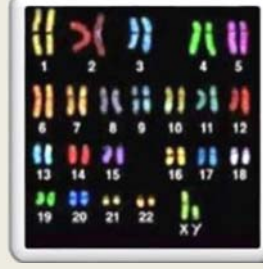
النمط النووي لأشرف