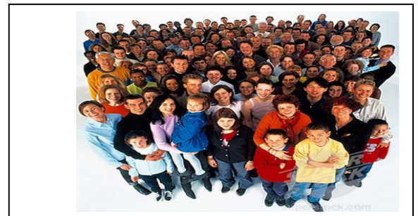
السند -3 :-

التعليمة: بالاعتماد على السندات المقدمة ( 4.3.2.1 ) و مكتسباتك القبلية ، اكتب فقره من 12 إلى 15 اسطر تبرزين فيها مراحل تطور السكان في الجزائر ؟