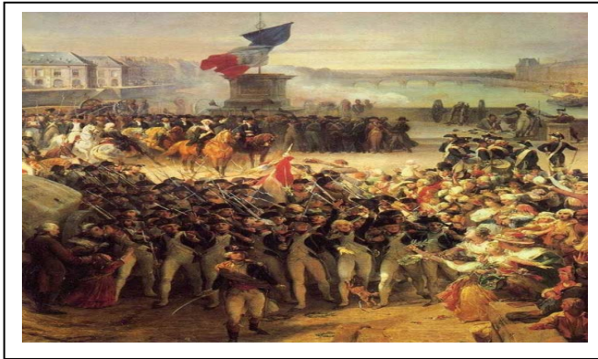
السند -2 :-