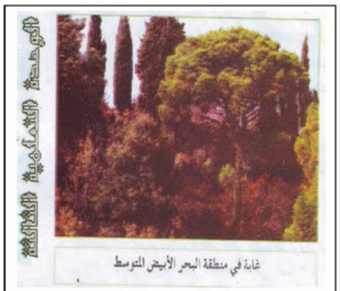
غابة في منطقة البحر الأبيض المتوسط

التعليمة: أكتب فقرة توضح من خلالها العلاقة و التكامل بين المظاهر الطبيعية في الجزائر و انعكاسها على