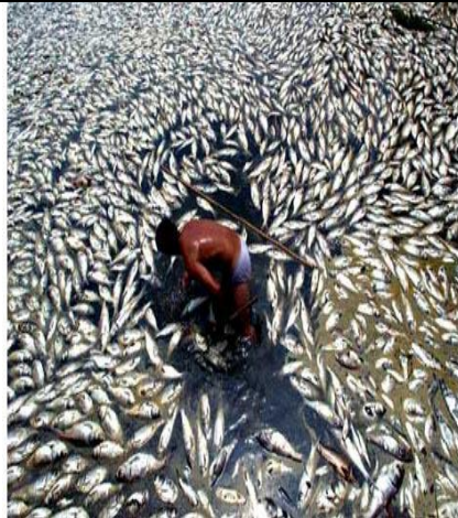
سند 2 / البترول مصدر للتلوث